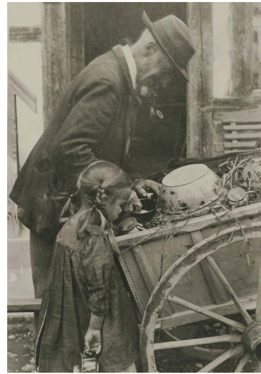
Heimberger Geschirrhäusierer, 1917. So oder ähnlich dürfte der Geschirrverkauf auch für das Bärswiler Geschirr von statten gegangen sein.

Soweit die namentlich genannten Personen aufgeschlüsselt werden können, haben wir es bei den mit Bärswiler Geschirr Beschenkten offenbar immer mit der geschäftstüchtigen, mit Ländereien handelnden und Geld verleihenden bäuerlichen Oberschicht der Region zu tun. Zu dieser Oberschicht gehören selbstverständlich auch die Müller. Die Darstellung eines Mühlrades auf einigen der Geschirre ist wohl ebenfalls als unmittelbarer Hinweis auf diesen Berufsstand und sein Selbstbewusstsein zu werten. Die nachweisbar ausgeübten Funktionen u. a. als Gerichtssässen, Amänner etc. lassen es als selbstverständlich erscheinen, dass die betreffenden Personen auch Schreib- und Lesefähigkeit besaßen, was sich in der Vielzahl der produzierten Tintengeschirre widerspiegelt. Im Militär gehören die Personengruppen aufgrund ihrer wirtschaftlichen «Potenz» bevorzugt zu den berittenen Dragonern, einer kleinen «Spezialeinheit» der bernischen Miliz.