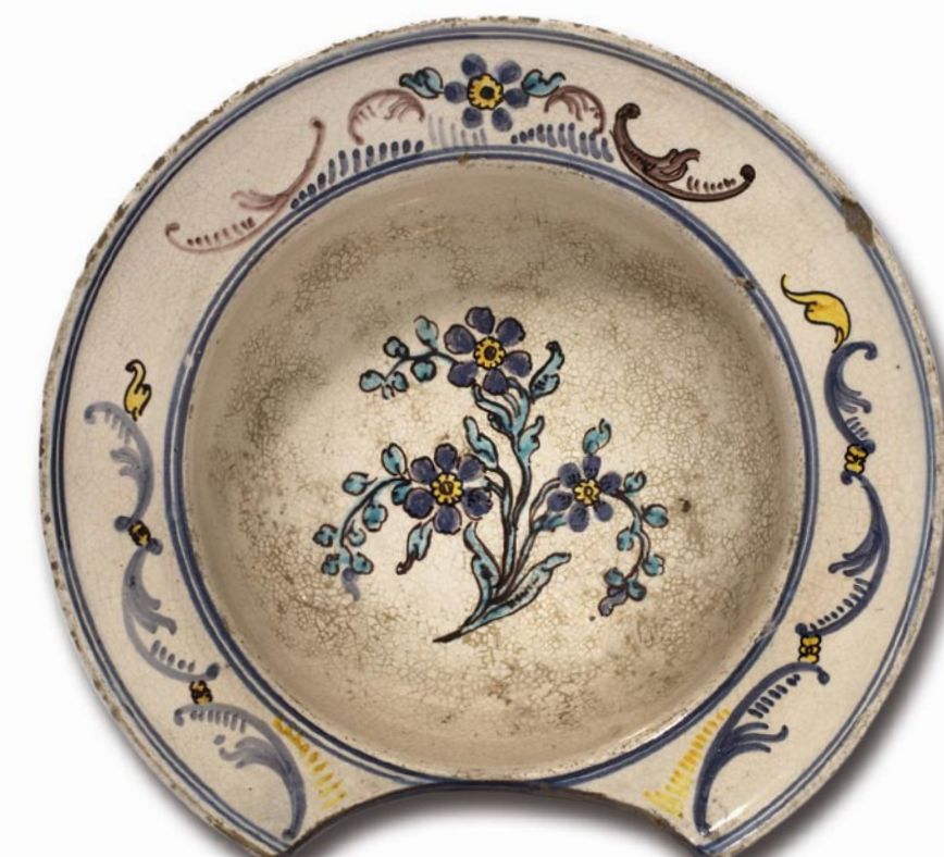
Die Bärswiler Keramik der Zeit zwischen ca. 1780 und ca. 1800 ist ausgesprochen vielfältig dekoriert. Sie wurde überwiegend von Jakob Kräuchi (1768–1831) und Ludwig Kräuchi (1770–1851), den Söhnen des Schneiders und Schulmeisters Ludwig Kräuchi (1743–1814) produziert.