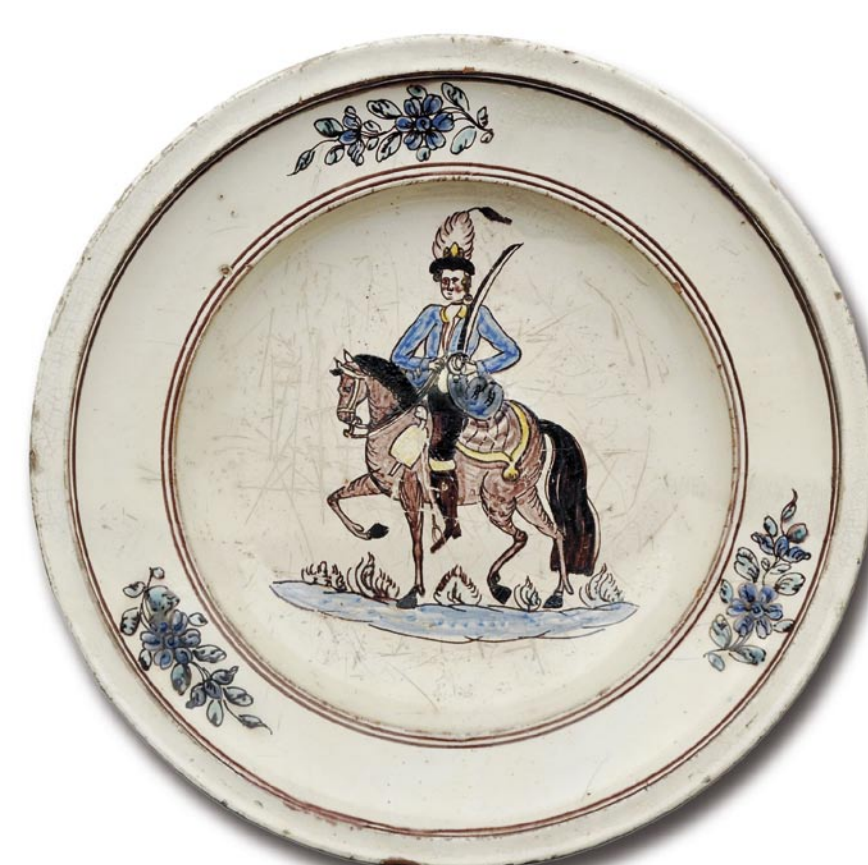
Zwischen 1800 und 1821 entstanden sehr einheitlich dekorierte Keramiken mit Tier-, Blumen-, Tracht- und Soldatendarstellungen.