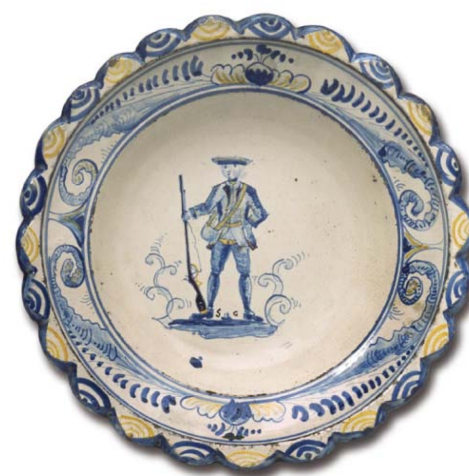
Die älteste Bärswiler Keramik (1758 bis ca. 1780) trägt Dekore in blau und gelb. Ganz selten finden sich bereits Soldatendarstellungen. Das Geschirr wurde von Jakob Kräuchi (geboren 1731, gestorben nach 1791), dem ersten Hafner Bärswils produziert (Fotos ADB Andreas Heege, SNM Donat Stuppan, BHM Yvonne Hurri).