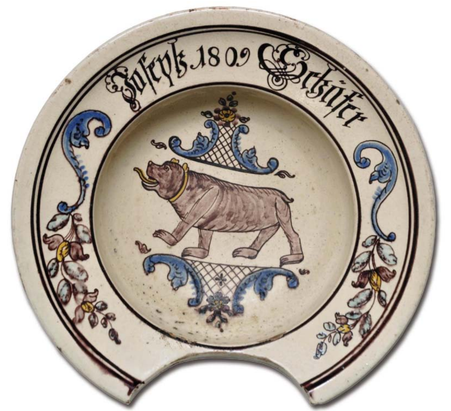
Unter den Tieren dominiert der Bär mit gelbem Halskragen, gelber Zunge und gelben Ohren. Er ist wohl als sprechendes Wappen für Bärswil anzusehen.