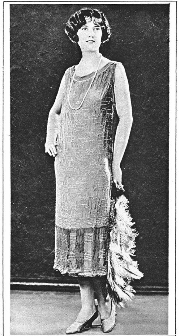
Elegantes Abendkleid aus rosa Crêpe Georgette mit Stahlperlen.

In den drei Bilderrahmen im Eingang der Gemeindeverwaltung finden Sie die schönsten Beispiele.